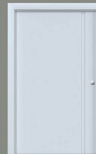
Ref E701C (Puxador Cava)